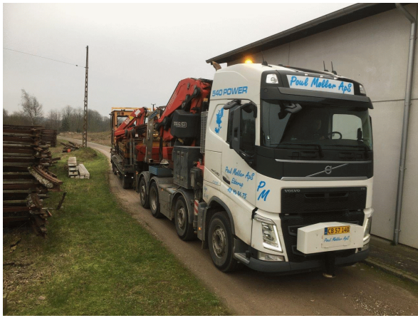
TR 127 er ankommet til Skjoldenæsholm.