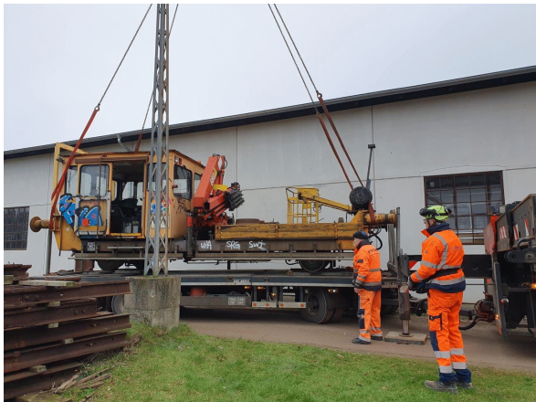
TR 127 klar til aflæsning