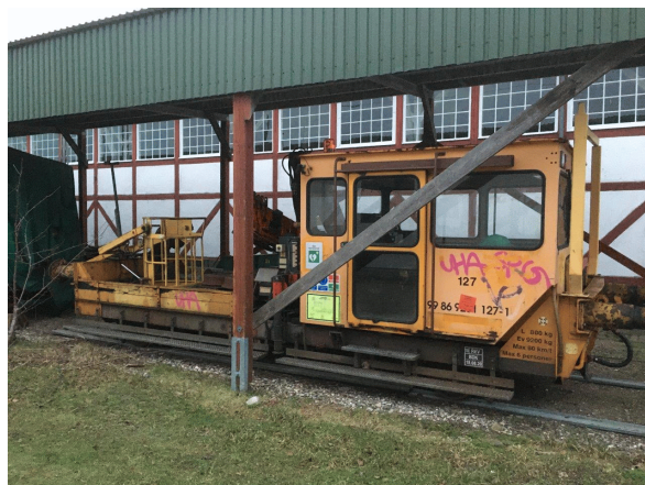
TR 127 er parkeret under Tramtaget.