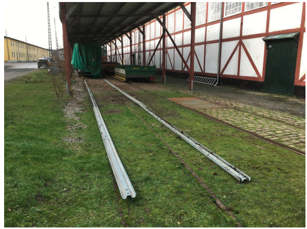
Skinner klar til aflæsning af TR 127.