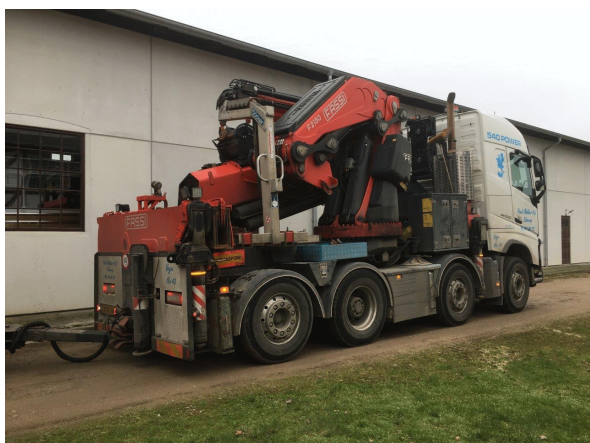
Vognmandens store kran.

Troljen har forskelligt, godt ekstraudstyr i forhold til vore øvrige troljer. Den er p.t. blevet henstillet på klatrespor (svensk autoværn) under "Tramtaget" bag Valby gamle Remise . Også en ældre, brugt troljeaksel fulgte med og skal senere adskilles for at vurdere, om det er muligt at omforandre og dermed ompore den til meterspor. På dette sporområde mangler vi meget en trolje, så lad os håbe, det på sigt kan lykkes! (ESt via BL)