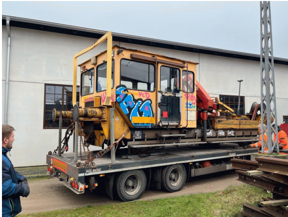
TR 127 på lad.