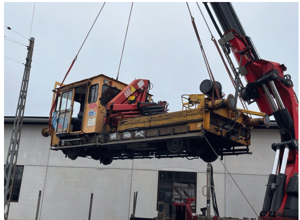
TR 127 er løftet op fra lad.