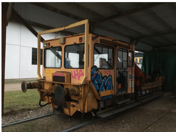
TR 127 er parkeret under Tramtaget.