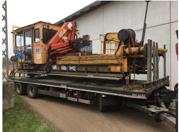
TR 127 på lad.