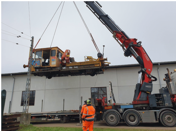
TR 127 er løftet op fra lad.