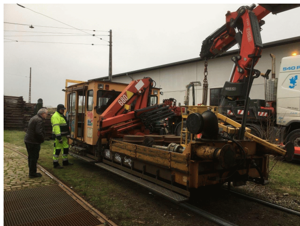
TR 127 er sporsat.