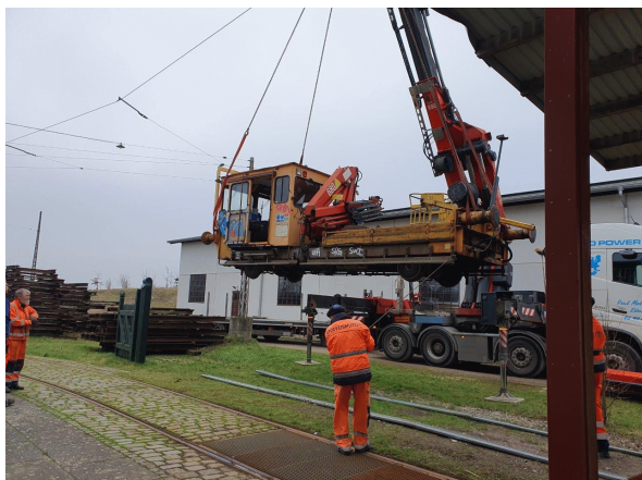
TR 127 sænkes ned mod skinner.