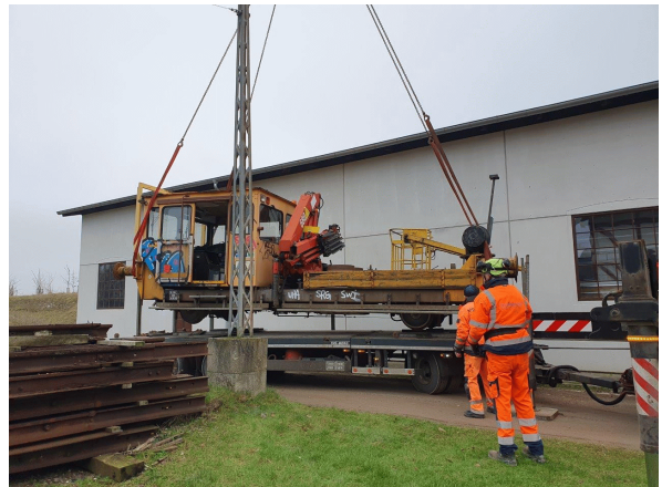
TR 127 løftes op fra lad.