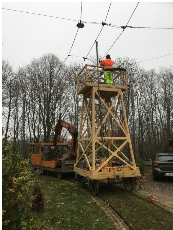
Udskiftning af kurveholder.

Troljen har forskelligt, godt ekstraudstyr i forhold til vore øvrige troljer. Den er p.t. blevet henstillet på klatrespor (svensk autoværn) under "Tramtaget" bag Valby gamle Remise . Også en ældre, brugt troljeaksel fulgte med og skal senere adskilles for at vurdere, om det er muligt at omforandre og dermed ompore den til meterspor. På dette sporområde mangler vi meget en trolje, så lad os håbe, det på sigt kan lykkes! (ESt via BL)